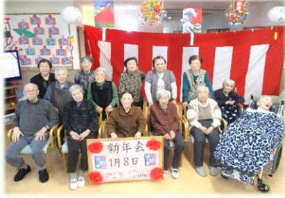
新年会ですごろくと二人羽織をして盛り上がりました。