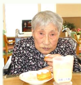
美味しく いただきました 😊