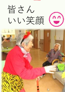
皆さん いい笑顔 😊