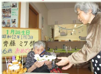
四戸様より プレゼント贈呈です!