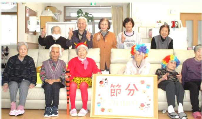
皆様、揃って記念撮影ハイポーズ 📷