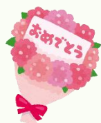
千葉様 お誕生日 おめでとうございます!!