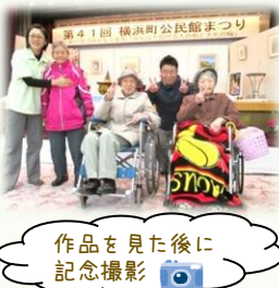
作品を見た後に 記念撮影