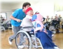
赤ちゃん(人形)渡し競争