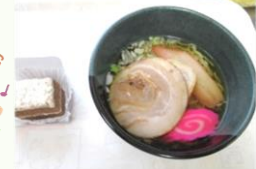
施設長の手作りラーメン