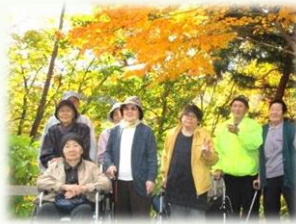
天気も良くて最高でした♪