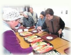
「どれにしようかな？」

11月15・16・17日 利用者の皆さんからの希望で、寿司バイキングを開催しました。 大好評でした。