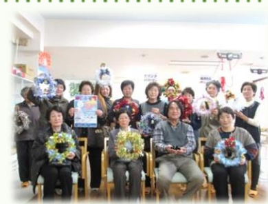
認知症になっても、安心してらせる町!!