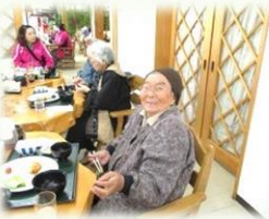
川内スパウッド観光ホテルで昼食です。