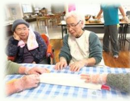
エプロン姿もステキでしょ!!