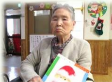
サンタさんを作り