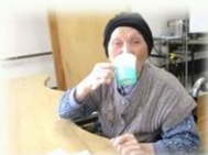
ケーキもコーヒーも満足ですう!!