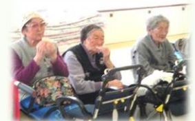
おいしくいただきました。