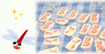
トンボ柄、リボン柄 かわいいでしょ❤️