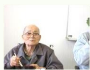
そばもおしるこも最高!