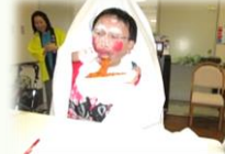
2人羽織で、スパゲティ〜