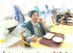
「おいなりさんが好き!!」