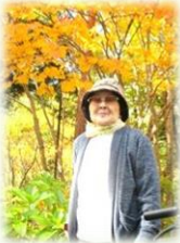
紅葉の前でパチリ