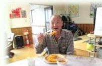
いっぱい いただきました♪