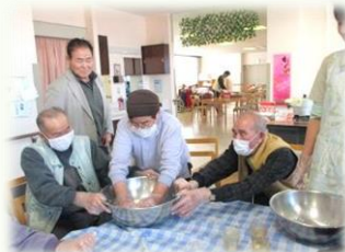
男性の方も興味津々

12月27・28日 年末に皆さんと「べこもち」を作りました。 きれいな模様が出るように悪戦苦闘して作りました。