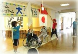
選手宣誓 「我々選手一同は…♪」