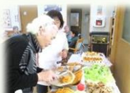
好きな食べ物を選んで