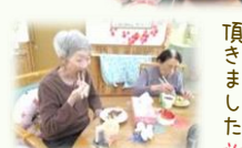
美味しく 頂きました